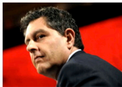
Liguria, centrodestra al bivio. Spunta Musso, su Toti non c'è unanimità - Secolo...