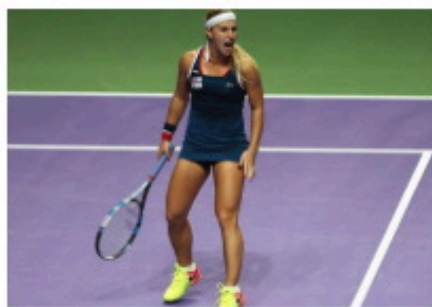
Le foto osé della bellissima Cibulkova